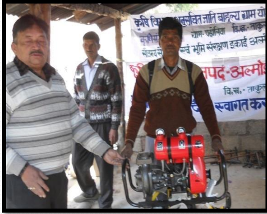
पावर बीडर वितरण कार्यक्रम