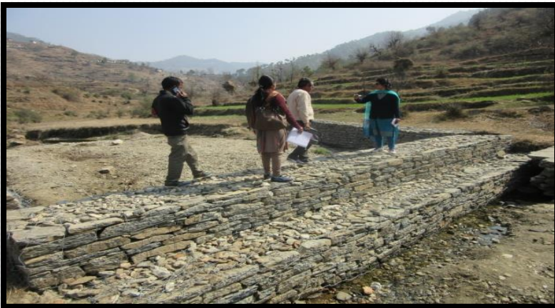
ग्राम –डुंगरी क्लस्टर– भैसियाछाना