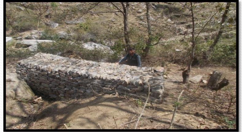
ग्राम-रतखाल, क्लस्टर स्याल्दे