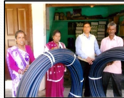
एच0डी0पी0ई0 पाईप वितरण कार्यक्रम

अनुसूचित जाति, जनजाति बाहुल्य ग्रामों में कृषि विकास कार्यक्रम।