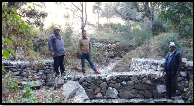
ग्राम-रतखाल, क्लस्टर द्वाराहाट